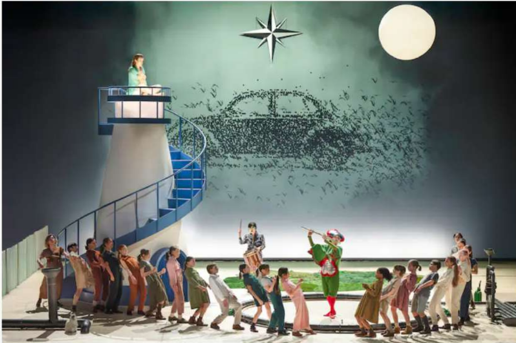
«Montag aus Licht» de Stockhausen, à Lille. (Hervé Escario)

L'ensemble du Balcon présente à la Philharmonie l'avant-dernier round du cycle du compositeur allemand Stockhausen. Un opéra tenu à bout de synthé depuis 2018, et en répétition à Lille en présence d'un groupe de lycéens séduits. Lire ici notre reportage.