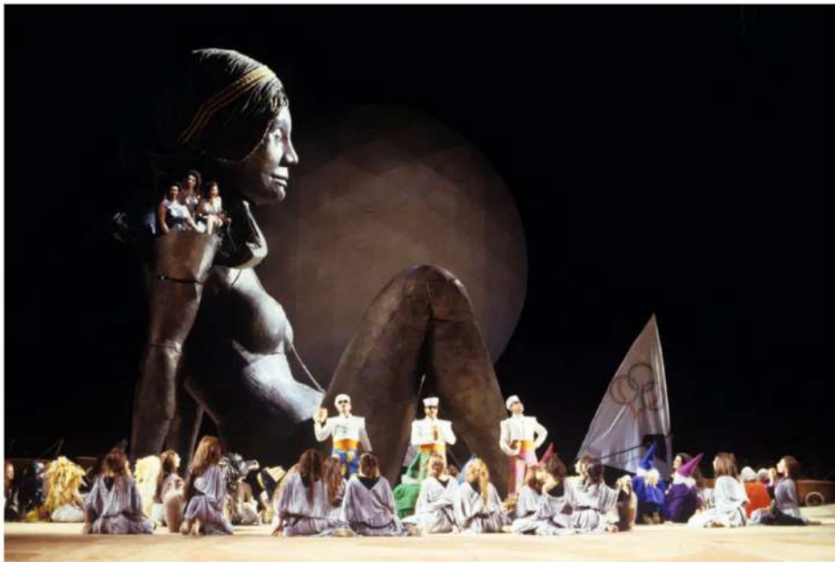
"Montag aus Licht" was first staged at La Scala in Milan in 1988, with a large sculpture of Eve as a naked woman dominating the stage.